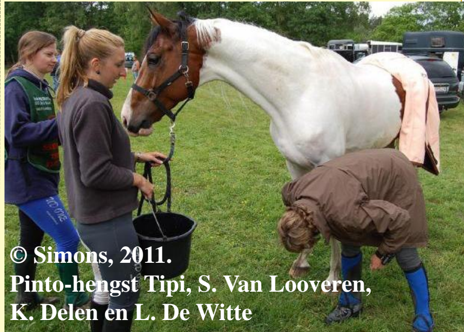
Pinto-hengst Tipi, S. Van Looveren, K. Delen en L. De Witte